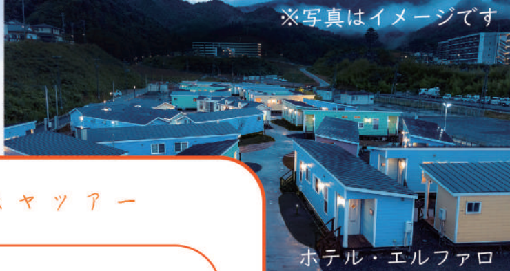
ホテル・エルファロ